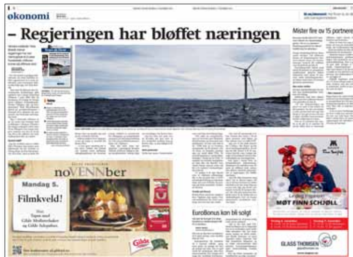
FAKSIMILE: I BT i går hevdet Venstre-nestleder Terje Breivik at regjeringen har lurte næringslivet til å satse på havvindkraft.

å bygge vindmøller langt ute i Norskehavet.